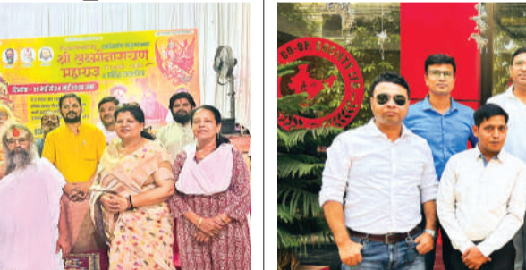
गुफा मंदिर में बैठक संपन्न।