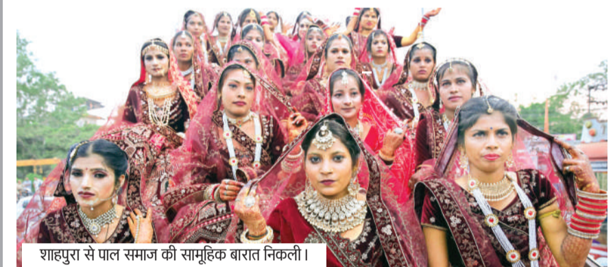
शाहपुरा से पाल समाज की सामूहिक भारत निकली।