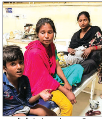
बच्ची की मौत के बाद शोकाकुल परिवार।