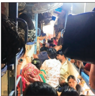
को मिल रही हैं। पहले से रिजर्वेशन करा स्लीपर कोच के यात्रियों पर ये भारी पड़ रही है। रात के समय इन कोच क्षमता से अधिक मुसाफिर नजर आते हैं। अधिकांश जनरल टिकट लेकर भी स्लीपर में सवार हो जाते हैं।

ट्रेन में स्लीपर कोच का हाल जनरल बोगी की तरह हो गया। पूरा डिब्बा यात्रियों से खचाखच भरा था। कंपर्म रिजर्वेशन लेकर आने वालों के पास केवल बैठने की जगह थी। बोगी के फर्श पर भी कई लोग बैठे थे तो किसी ने यहां बिछौना ही डाल लिया। यह स्थिति रविवार शाम संत हिरदाराम नगर रेलवे स्टेशन डा. अंबेडकर नगर - प्रयागराज एक्सप्रेस में देखने को मिली। दरअसल, कंपर्म रिजर्वेशन के बाद भी मुसाफिरों की फर्जीबत हो रही है। रेल यात्रियों के अनुसार स्लीपर कोच में क्षमता से अधिक यात्री सवार हो रहे हैं। ऐसे में ट्रेन में भीड़ अधिक होने के चलते टॉयलेट तक नहीं जा पा रहे हैं। दरअसल, इन दिनों शादियों के सीजन के चलते ट्रेनों में भीड़ अधिक देखने