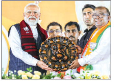
एजेसी ► बांकुरा

बंगाल में गरजे प्रधानमंत्री मोदी, टीएमसी के साथ ही कांग्रेस पर किया बड़ा हमला