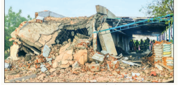
विस्फोट के बाद वनजा पटाखा फैक्ट्री पूरी तरह से ध्वस्त

भाजपा की राष्ट्रीय उपाध्यक्ष रेखा वर्मा ने कहा कि प्रधानमंत्री व गृह मंत्री ने स्पष्ट किया कि नारी शक्ति वंदन अधिनियम पारित करने दीजिए, क्रेडिट भी आप ही ले लीजिए, मुझे क्रेडिट भी नहीं चाहिए। इसके बाद भी विपक्ष ने बिल का विरोध किया। उन्होंने कहा कि 70 साल से देश की नारी अपने अधिकार की लड़ाई लड़ रही थी और 33% आरक्षण की मांग कर रही थी। कांग्रेस महिलाओं को उनका अधिकार भी नहीं दे रही है। कांग्रेस को देश की महिलाएं कभी भी माफ नहीं करेंगी। ▶▶ पढ़ें पेज 02 व 03 भी