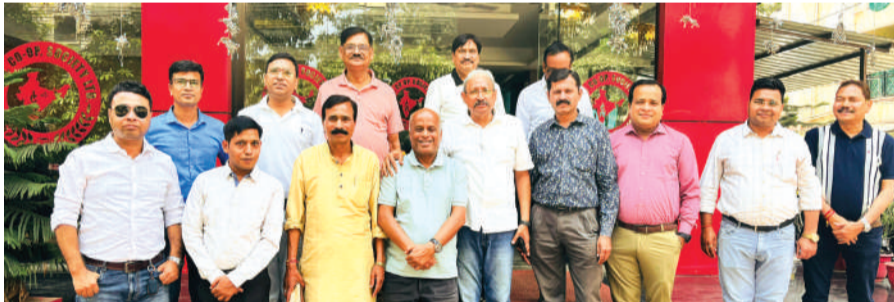
अग्रहरि समाज की बैठक संपन्न हुई।