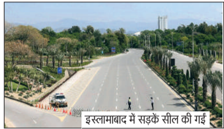
इस्लामाबाद में सड़कें सील की गईं

उच्च स्तरीय अमेरिकी प्रतिनिधिदल की सुरक्षा टीम इस्लामाबाद पहुंची