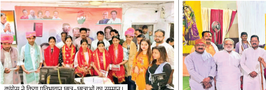
कॉंग्रेस ने किया प्रतिभावान छात्र-छात्राओं का सम्मान।