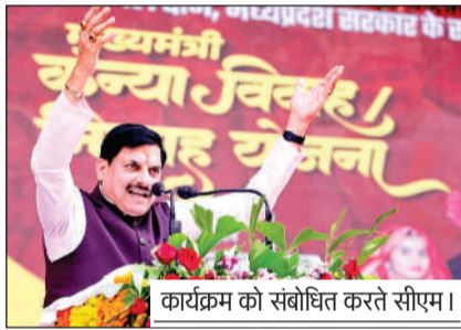
कार्यक्रम को संबोधित करते सीएम।

मुख्यमंत्री डॉ. मोहन यादव ने कहा कि सामूहिक विवाह समाज में समरसता और अपनत्व की भावना बढ़ाते हैं। उन्होंने कहा कि वैवाहिक संस्कार एक दिन का आयोजन नहीं बल्कि अक्षय मूल्यों और अक्षय संस्कारों की स्थापना है। विवाह संस्कार दो परिवार को जोड़ने का प्रसंग होता है। मुख्यमंत्री डॉ. यादव रविवार को उज्जैन में नगर निगम की ओर से क्षिप्रा तट स्थित कार्तिक मेला मैदान पर आयोजित मुख्यमंत्री कन्या विवाह निकाह कार्यक्रम को संबोधित कर रहे थे। अक्षय तृतीया के पवित्र दिवस पर बाबा महाकाल और मां हर सिद्धि की कृपा से 112 जोड़ों का विवाह संपन्न हुआ। मुख्यमंत्री ने कहा कि उज्जैन को पावन धरा पर धर्म का सबसे अनूठा संगम हो रहा है। एक ओर बेटियों का कन्यादान कर रहे हैं वहीं दूसरी ओर सिंहस्थ