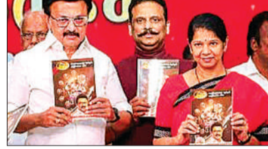
सीएम स्टालिन ने जारी किया द्रविड़ मॉडल 2.0 घोषणापत्र

प्रधानमंत्री ने महिला आरक्षण विधेयक के विरोध को लेकर द्रमुक पर कड़ा प्रहार किया है। पीएम मोदी ने आरोप लगाया कि द्रमुक ने समर्थन करने के बावजूद यू-टर्न ले लिया है। उन्होंने तमिलनाडु की सत्ताधारी पार्टी पर महिला कल्याण की जगह राजनीति को प्राथमिकता देने का आरोप लगाया।