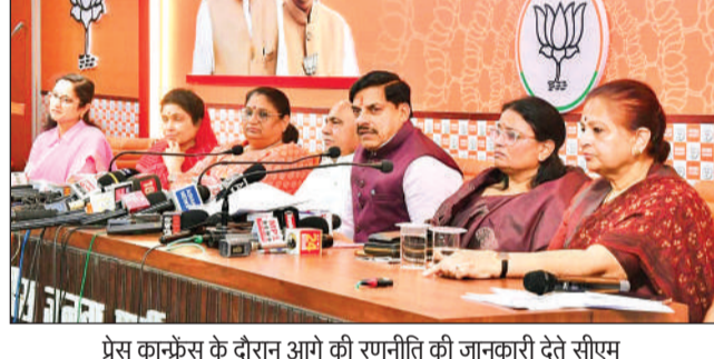
प्रेस कांफ्रेंस के दौरान आगे की रणनीति की जानकारी देते सीएम

प्रदेश भर में पदयात्राएं और आक्रोश सभाएं होंगी