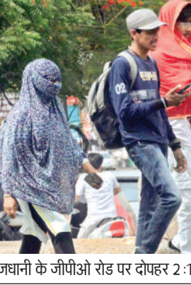
राजधानी के जीपीओ रोड पर दोपहर 2:10 बजे का दृश्य

बैतूल, हरदा, बुरहानपुर, खंडवा खरगोन, छिंदवाड़ा, पांडुरंगा में आंधी के साथ बौछारें पड़ेगी हरिभूमि न्यूज ॥ गोपाल राजधानी सहित अधिकांश जिलों में रविवार को गर्मी और बढ़ गई। 5 जिलों में लू चली। प्रदेश में सबसे गर्म रहे नौगांव में पारा 44.3 डिग्री रहा। साथ ही छिंदवाड़ा, मंडला, मलाजखंड और रतलाम में लू का असर रहने से लोगों को परेशानी का सामना करना पड़ा। यहां पारा 43 से 44 डिग्री के बीच और सामान्य से 5 से 6 डिग्री तक अधिक दर्ज हुआ है। भोपाल में दिन का पारा अप्रैल वर्ष 2022 के बाद सर्वाधिक 41.8 ▶▶ शोष पेज 4 पर