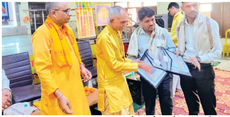
हरिभूमि न्यूज ►► मोपाल

अखिल विश्व गायत्री परिवार शांतिकुंज हरिद्वार के मार्गदर्शन में जिला स्तरीय भारतीय संस्कृति ज्ञान परीक्षा पुरस्कार वितरण एवं शिक्षक सम्मान समारोह रविवार को गायत्री शक्तिपीठ