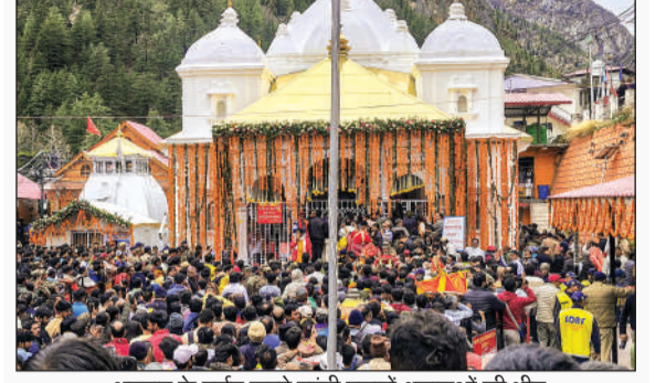
भगवान के दर्शन करने पहुंची हजारों श्रद्धालुओं की भीड़

पीएम की मां की फोटो लेकर पहुंचा बच्चा, वे बोले-आपने मुझे भावुक कर दिया पुरलिया में एक जनसभा को संबोधित करते हुए अपना भाषण बीच में ही रोक दिया, उनकी नजर एक छोटे बच्चे पर गई जो उनकी मां की फोटो लेकर पहुंचा था, पीएम मोदी ने उस बच्चे से बात की और उसे थैक्यू कहा। प्रधानमंत्री ने एसपीजी को निर्देश देकर वो तस्वीर अपने पास मंगवाई और कहा कि मां की तस्वीर देखकर वो भावुक हो गए। पीएम मोदी ने कहा कि थैक्यू बेटा, बहुत-बहुत शुक्रिया। मैं आपका बहुत आभारी हूँ, आप मेरी मां की तस्वीर लेकर ▶▶ शोष पेज 4 पर