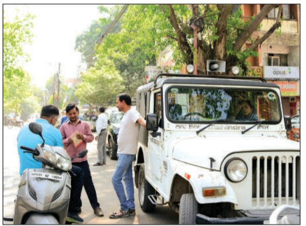
नोडल अधिकारियों की टीम को लेकर निगम का अमला मुस्तेद रह।

निगम आयुक्त ने शहरभर में नोडल अधिकारियों को निरीक्षण की जिम्मेदारी दी है। जबकि शहर के सभी 21 जौन और 85 वार्डों में आम दिनों की तर्फ सफाई मित्र, द्रोग एचओ, डोर-टू-डोर कचरा कलेक्शन शुरू हो रहा है। इस दौरान मुख्य सड़कों, बाजारों, सार्वजनिक स्थलों पर अधिक ध्यान दिया जा रहा है।