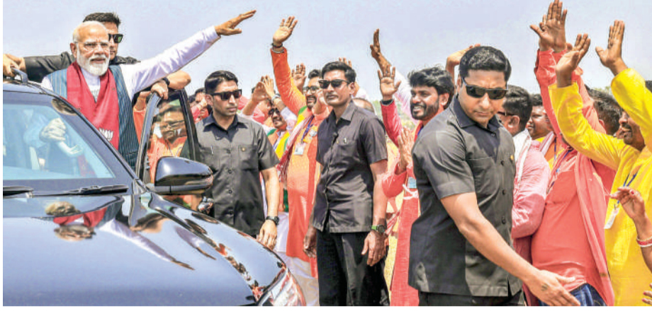
पश्चिम बंगाल में रोड शो के दौरान जनता का अभिवादन करते पीएम मोदी

पीएम मोदी ने कहा कि अगर बंगाल में भाजपा की सरकार बनती है, तो महिलाओं को पांच लाख तक का मुफ्त इलाज मिलेगा। बंगाल की बहनों को हर साल 36,000 रुपए मिलेंगे। गर्भवती महिलाओं को 21,000 रुपए दिए जाएंगे। बेटियों की शिक्षा के लिए 5,000 रुपए देगी। मुद्रा योजना के तहत महिलाओं को स्वरोजगार के लिए 20 लाख रुपए मिलेंगे। कृषि से जुड़ी महिलाओं को सालाना 9,000 रुपए अतिरिक्त मिलेंगे।