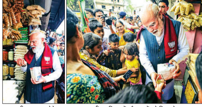
झालमुरी का स्वाद लेते हुए

पश्चिम बंगाल में चुनाव प्रचार में जुटे पीएम नरेंद्र मोदी ने पारंपरिक फूड का स्वाद लिया। पीएम ने इसकी तस्वीर सोशल मीडिया पर साझा की है। झारखाम में जनसभा को संबोधित करने के बाद पीएम हैलिपेड ग्राउंड जाते समय अचानक कॉलेज कॉलेज मोड़ पर रुके। जहां उन्होंने एक स्थानीय दुकान से झालमुरी खाई और आम लोगों से बातचीत की। पीएम ने दुकान वाले को 10 रुपये भी दिए। इस दौरान उन्होंने लोगों के साथ झालमुरी को बांटा भी। दुकानदार