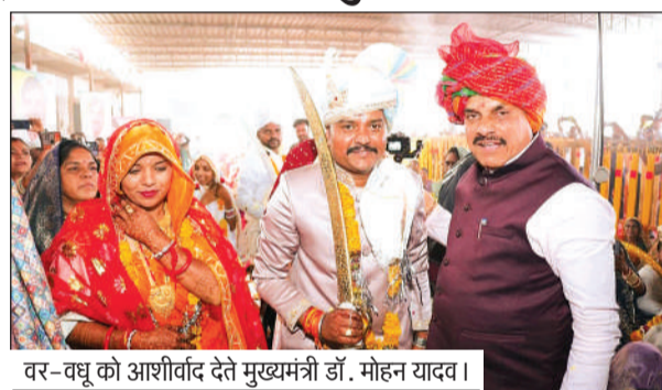
वर-वधू को आशीर्वाद देते मुख्यमंत्री डॉ. मोहन यादव।

मुख्यमंत्री डॉ. मोहन यादव ने कहा कि सामूहिक विवाह समाज में समानता, सादगी और सामाजिक सद्भाव को बढ़ावा देने का एक अनुकरणीय माध्यम है। आज अक्षय तृतीया का पावन अवसर है। इस मौके पर किए गए किसी भी शुभ कार्य का फल अक्षय होता है। आज का यह दिन सभी नव-विवाहित जोड़ों के लिए अत्यंत शुभ और मंगलकारी सिद्ध हो। 23 जोड़ों का सामूहिक विवाह संपन्न हुआ रविवार को मुख्यमंत्री और परशुराम जयंती के पावन अवसर पर मुख्यमंत्री ने हामूखेड़ी देवास रोड में आयोजित सामूहिक विवाह सम्मेलन में बतौर मुख्य अतिथि सहभागिता की। कार्यक्रम के दौरान 23 जोड़ों का सामूहिक विवाह सम्पन्न हुआ।