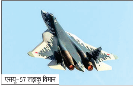
एसयू-57 लड़ाकू विमान