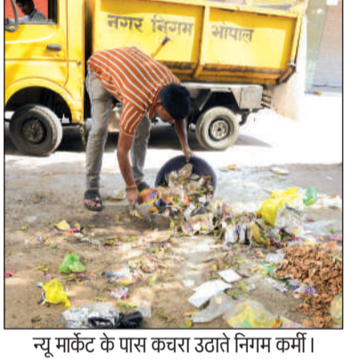
न्यू मार्केट के पास कचरा उठाते निगम कर्मी।

चुनावभट्टी, शाहपुरा, न्यू मार्केट, मेल, सेंट नगर, कोलार, बैरसिया रोड सहित शहर के सभी मुख्य बाजारों, मॉल, अस्पताल, पार्क, तालाब, सुलभ कॉम्प्लेक्स व कई कॉलोनिनों में नोडल अधिकारी अपने वाहन में घुमे। इस दौरान कहीं नाली की सफाई करते हुए कर्मचारी मिले तो कहीं सफाई मित्र कचरा उठा रहे थे।