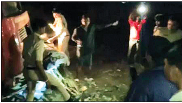
हादसे के वक्त अफरा-तफरी मच गई।