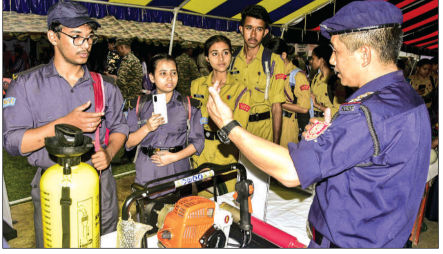
गुवाहाटी। असम के गुवाहाटी में सेना, एनडीआरएफ, एसडीआरएफ और एसएफबी द्वारा आयोजित संयुक्त बाढ़ राहत अभ्यास 'जल राहत' के दौरान एक एनडीआरएफ कर्मी छात्रों को बचाव उपकरण की जानकारी देता हुआ।