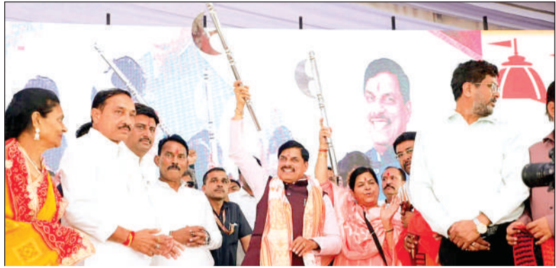
जानापाव में मुख्यमंत्री डॉ. यादव को भगवान परशुराम प्रकटोत्सव में प्रतीक स्वरूप फरसा भेंट किया गया।

मुख्यमंत्री ने भगवान परशुराम की जन्म-स्थली पर की पूजा-अर्चना